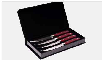
ASTUCCIO CON CHIUSURA CALAMITATA - CASE WITH MAGNETIC CLOSURE

Pratico set di coltelli da bistecca per tagliare carne, tacchino e pollame. Realizzati in acciaio inox hanno un'elevata efficienza di taglio che impedisce al cibo di strapparsi o attaccarsi al coltello da bistecca dopo il taglio.