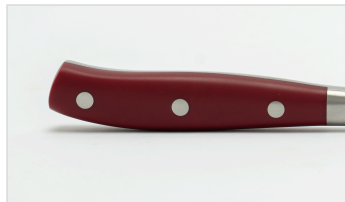
MANICO ERGONOMICO - ERGONOMIC HANDLE