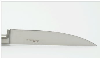
SCORRIMENTO FLUIDO - SMOOTH GLIDE